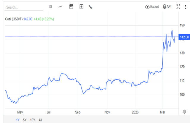
Grafik harga saham batu bara May 2025 – Maret 2026